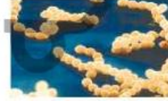
روماتیسیم قلبی (۳)