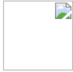
علوی دخترانه مرکز

نام آزمون: نمونه سوال اقتصاد (درس ۱ تا ۷)