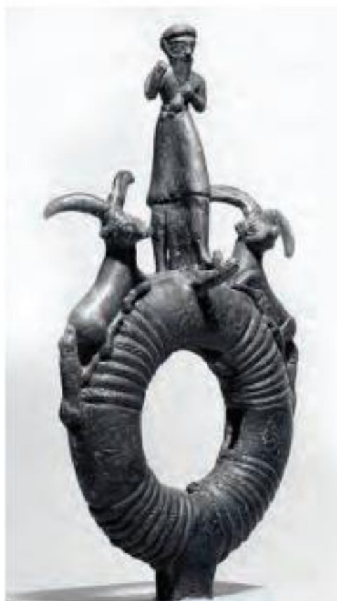
این تصویر سر باقیمانده از یک برجم ایلامی از جنس برنز است.