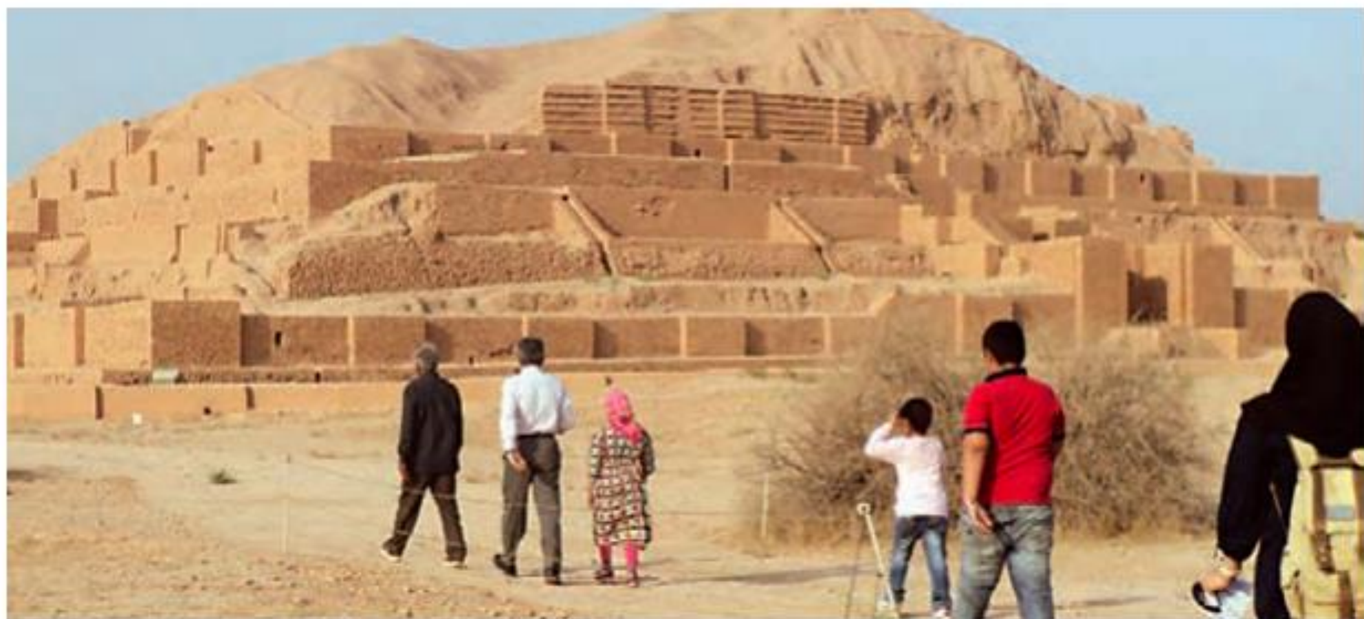
گردشگران در حال بازدید از معبد جُغازنبیل که از دوره‌ی تمدن ایلام به‌جا مانده است. (استان خوزستان)