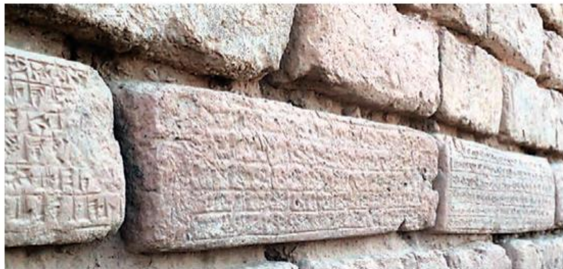
بخشی از دیوار جغاز نیبل که روی آجرهای آن خط ایلامی ها دیده می شود.