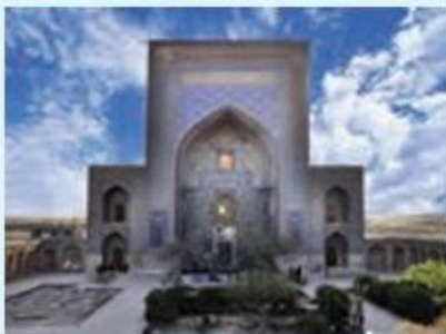
آرامگاه شیخ زین‌الدین تائبادی - شهرستان تائباد

تیمور گورکانی در یکی از یورش‌های خود به ایران، چون به تربت جام رسید، بر آن شد که از مولانا شیخ زین‌الدین ابوبکر تائبادی، یکی از مشایخ بزرگ صوفی دیدن کند. جمعی از بزرگان شهر از مولانا تائبادی تقاضا کردند که دعوت امیر تیمور را گردن نهد، ولی او امتناع کرد و گفت: «فقیر را با امیر هیچ مهمی نیست». چون تیمور اصرار کرد، مشایخ و بزرگان ضمن نامه‌ای به حکم مصلحت از مولانا خواستار شدند که با تیمور ملاقات کند، اما ابوبکر تائبادی همچنان امتناع ورزید و گفت: «من مردی روستایی هستم و تکلفات درباری نمی‌دانم». تیمور خود روی به اقامتگاه مولانا تائبادی نهاد، و به عزلتگاه شیخ رفت و از او خواست که نصیحتی گوید. او امیر را به عدل و داد نصیحت نمود و گفت: «از ظلم و جور بپرهیز و اتباع خود را از اعمالی که بر خلاف دیانت است منع کن.» امیر تیمور