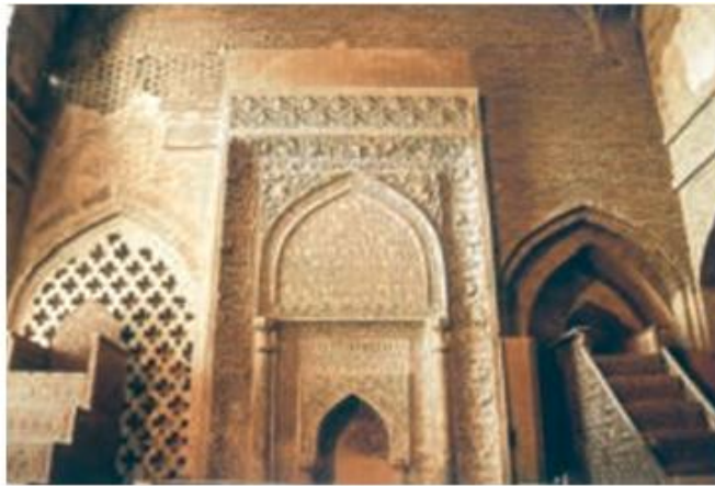
محراب مسجد جامع اصفهان