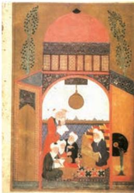
خواجه نصیرالدین توسی و دانشمندان دیگر هنگام کار در رصدخانه مراغه

برخی علوم مورد نیاز ایلخانان از قبیل ریاضیات، نجوم، پزشکی و علوم دیگری از قبیل فلسفه، عرفان و فقه از رونق خاصی برخوردار بودند و آثار مهمی در این رشته‌ها تدوین شد. نقش خواجه نصیرالدین توسی در این عرصه بسیار مهم بود. وی بسیاری از دانشمندان متواری در برابر هجوم مغولان را به ایران برگرداند و با تجمع ایشان در مرکز علمی رصدخانه مراغه زمینه فعالیت‌های علمی آنها را هموار کرد. در عصر تیموریان نیز علوم مختلف رونق داشتند و به ویژه معارف دینی از اقبال بیشتری برخوردار بودند. مراکز علمی و کتابخانه‌های شهرهای هرات و سمرقند در زمان جانشینان تیمور بسیار فعال بودند و طالبان علم را از سراسر ایران و جهان اسلام به خود جذب می‌کردند. وجود شمار قابل توجه دانشمندانی که در رشته‌های مختلف علمی تبحر داشتند، نشانه‌ای از رشد و رونق علوم مختلف در دوره تیموری است.