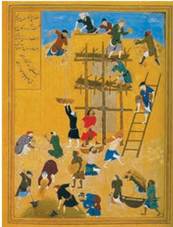
خمسه نظامی (ساختن کاخ خورنق) اثر کمال‌الدین بهزاد نقاش مکتب هرات سال ۸۹۹ ق

هنر نگارگری در روزگار جانشینان تیمور چون شاهرخ و نوادگانش از جمله بایسنقر میرزا، در سراسر ایران به ویژه خراسان گسترش شگفت‌انگیز یافت. در این دوره، مصور کردن کتاب‌های گوناگون از نجوم گرفته تا شاهنامه و دیوان‌های شعر به لحاظ کمی و کیفی افزایش پیدا کرد و کتاب‌هایی با قطع بزرگ پدید آمد. کیفیت خوب و فراوانی کاغذ و مواد نگارگری از قبیل رنگ و طلا در پدید آمدن کتاب‌های مصور به هنرمندان کمک زیادی کرد. فاخرترین نمونه شاهنامه مصور شده در عصر تیموری، شاهنامه باسنقری است که به دستور شاهزاده بایسنقر، پسر شاهرخ که سیاستمداری هنرمند و هنرپرور بود، خوشنویسی و مصور شد.