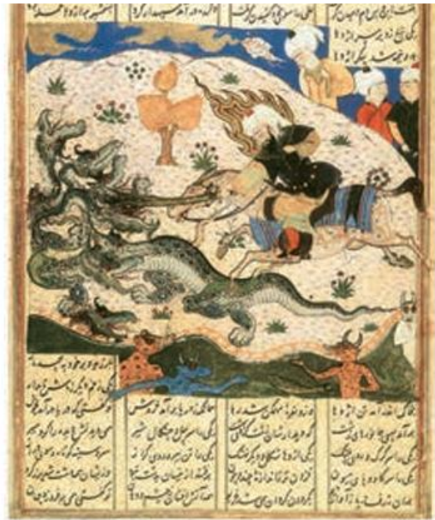
برگی از ظفرنامه شرف الدین علی یزدی