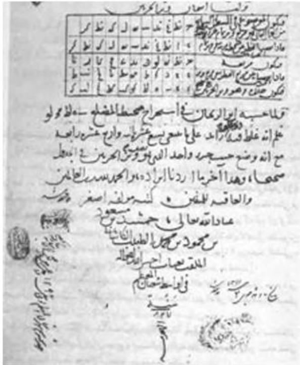
صفحه آخر رساله محیطیه - کتابخانه آستان قدس رضوی، شماره ۲۲۹

غیاث‌الدین جمشید کاشانی (۷۹۰ – ۸۳۲ق)، زبردست‌ترین ریاضی‌دان و مدیر رصدخانه سمرقند بود. او کتاب زیج خاقانی را در تکمیل زیج ایلخانی نوشت و ابزاری رصدی به نام «طَبَقُ الْمَنَاطِقِ» اختراع کرد. وی در دو رساله مهم خود، «محیطیه» و «وتر و جیب»، به ترتیب عدد پی را با دقتی کم‌نظیر و نیز مقدار بسیار دقیقی برای سینوس یک درجه حساب کرد. کسره‌های دهگانی را که نخستین بار اقلیدس به آنها اشاره کرده بود، در قیاس با کسره‌های شصتگانی دوباره رایج کرد. روش‌های محاسباتی وی بسیار پیشرفته‌تر از زمان خودش بود و می‌توان آن را با روشی که مدت‌ها بعد فرانسوا ویت (ریاضی‌دان بزرگ فرانسوی در قرن ۱۶م) پدید آورد، مقایسه کرد. (دائرة المعارف بزرگ اسلامی، ج ۱۰، مدخل ایران، ص ۶۶۹).