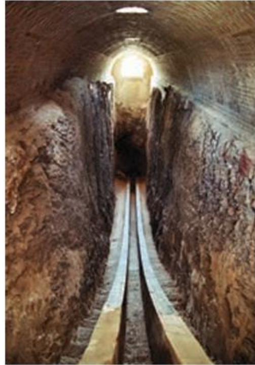
رصدخانه الغیبگ - سمرقند