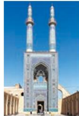
سردر و مناره‌های مسجد جامع یزد