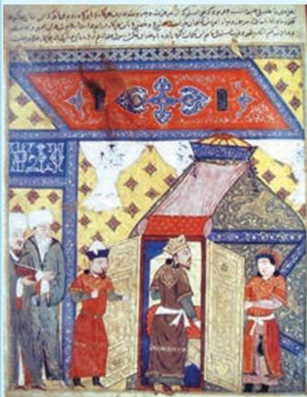
نگاره اسلام آوردن غازان خان

تکودار (حک ۶۸۱ - ۶۸۳ ق) پسر هولاکوخان، نخستین ایلخان مسلمان به شمار می‌رود. او پیش از رسیدن به حکومت، مسلمان شد و نام اسلامی احمد را برای خود برگزید. دولتمردان ایرانی و در رأس آنها شمس‌الدین محمد جوینی، نقش زیادی در به قدرت رساندن وی داشتند. تکودار در دوران کوتاه فرمانروایی خود اقدامات مؤثری در سیاست داخلی و خارجی به نفع مسلمانان انجام داد. اگرچه این ایلخان مسلمان توسط ارغون که از سوی بزرگان و شاهزادگان غیرمسلمان مغول پشتیبانی می‌شد، از قدرت برکنار و کشته شد، اما بزرگان ایرانی بر تلاش خود برای مسلمان شدن مغولان و مهار رفتارهای غیرمدنی آنها افزودند. آنان سرانجام موفق شدند که غازان‌خان، هفتمین ایلخان را که شخصیت مقتدری داشت به دین اسلام رهنمون سازند (۶۹۴ ق). بسیاری از امیران و سپاهیان مغول نیز به تبعیت از وی مسلمان شدند. غازان که نام اسلامی محمود را بر خود نهاده بود، اسلام را دین رسمی اعلام کرد و در مسجد جامع تبریز نماز گزارد. وی اقدامات مهمی در جهت اسلامی کردن جامعه و حکومت انجام داد و برای سادات و مشایخ و بزرگان دین، مقرری تعیین نمود.