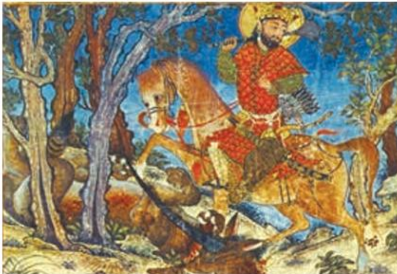
برگی از شاهنامه دموت - بهرام گور در حال شکار، موزه هنر دانشگاه هاروارد

هنر نگارگری و نقاشی در عصر ایلخانی و تیموری رونق و رشد بسزایی داشت. در عصر ایلخانان، هنر نگارگری که تلفیقی از سنت‌های نقاشی ایرانی و چینی بود، بیشتر در کتاب‌آرایی و مصورساختن کتاب‌های تاریخی و متون ادبی و نیز کتاب‌های پزشکی، جانورشناسی و نجوم جلوه‌گر شد. ایلخانان مغول از مشوقان پدید آوردن شاهنامه‌های مصور به شمار می‌روند. نمونه باقی مانده آن، شاهنامه مشهور به دموت ۱ است.