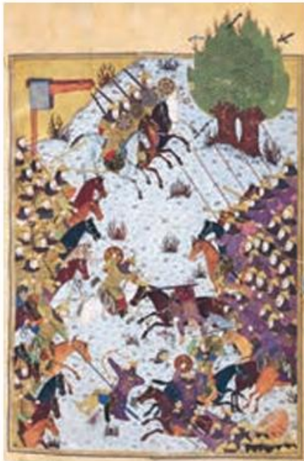
صفحه ای از نگاره‌های شاهنامه باسنقری

هنر نگارگری در روزگار جانشینان تیمور چون شاهرخ و نوادگانش از جمله بایسنقر میرزا، در سراسر ایران به ویژه خراسان گسترش شگفت‌انگیز یافت. در این دوره، مصور کردن کتاب‌های گوناگون از نجوم گرفته تا شاهنامه و دیوان‌های شعر به لحاظ کمی و کیفی افزایش پیدا کرد و کتاب‌هایی با قطع بزرگ پدید آمد. کیفیت خوب و فراوانی کاغذ و مواد نگارگری از قبیل رنگ و طلا در پدید آمدن کتاب‌های مصور به هنرمندان کمک زیادی کرد. فاخرترین نمونه شاهنامه مصور شده در عصر تیموری، شاهنامه باسنقری است که به دستور شاهزاده بایسنقر، پسر شاهرخ که سیاستمداری هنرمند و هنرپرور بود، خوشنویسی و مصور شد.