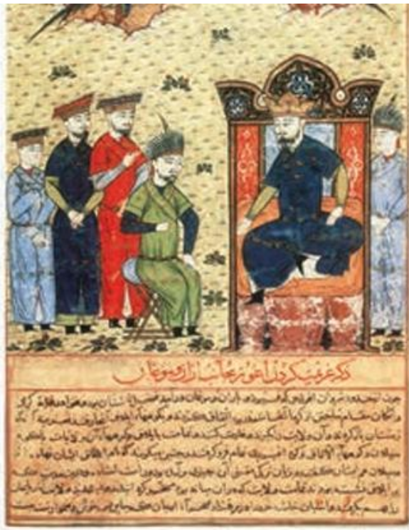
برگی از جامع التواریخ، تقاضی با ابرنگ و آب طلا