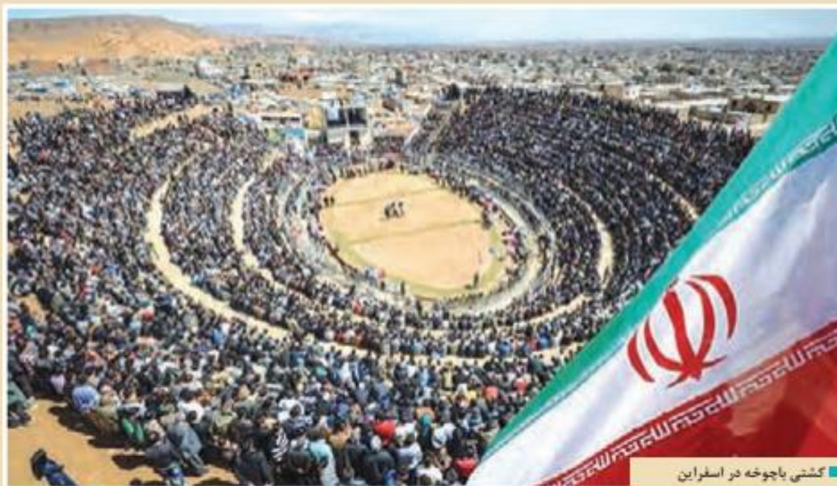
■ گشتی باجوخه در اسفراین