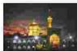
حرم امام رضا (ع)