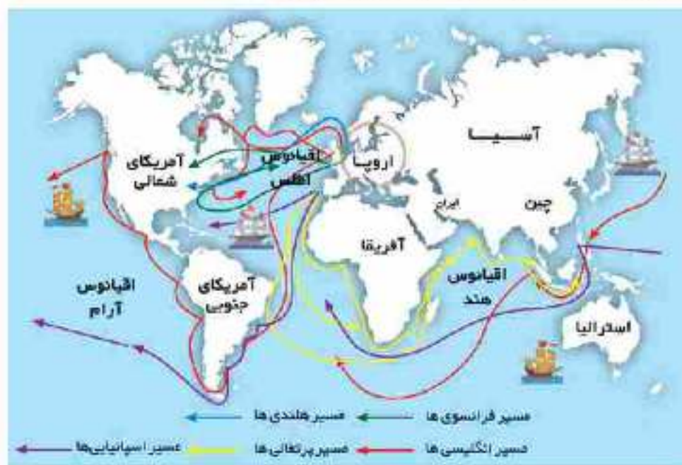
نقشه‌ی مسیرهای اکتشافات جغرافیایی

۷۱- با توجه به نقشه‌ی مسیرهای اکتشافات جغرافیایی به سؤالات زیر پاسخ بده.