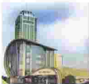
مرکز تجارت جهانی تبریز

ب) تصاویر زیر بیانگر معماری مدرن در سه شهر ایران هستند. با دقت به سبک ساخت و معماری آن‌ها توجه کن. یکی را انتخاب و در صفحه‌ی بعد با رعایت جزئیات (با استفاده از انواع خط) بکش. (رنگ‌آمیزی نیازی نیست).