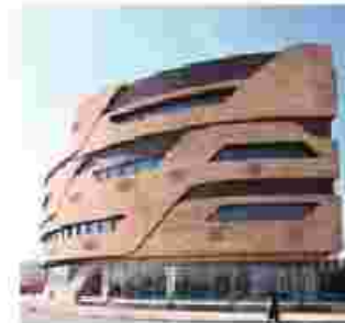
سبیتی ستر اصفهان