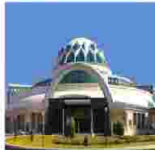
مجتمع الماس شرق مشهد