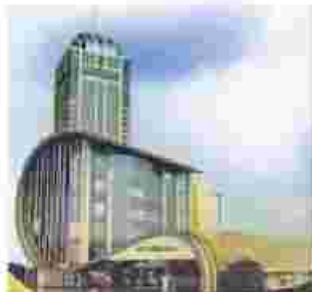
مرکز تجارت جهانی تبریز

ب) تصاویر زیر بیانگر معماری مدرن در سه شهر ایران هستند. با دقت به سبک ساخت و معماری آن‌ها توجه کن. یکی را انتخاب و در صفحه‌ی بعد با رعایت جزئیات (با استفاده از انواع خط) بکش. (رنگ آمیزی نیازی نیست).