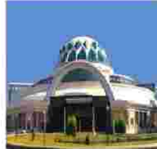
مجتمع الماس شرق مشهد