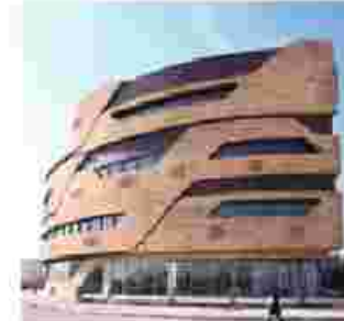
سیتی سنتر اصفهان