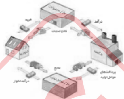
(کتاب درسی یا تغییر) (درس ششم - جایگاه دولت در جریان چرخشی درآمد) (دشوار)