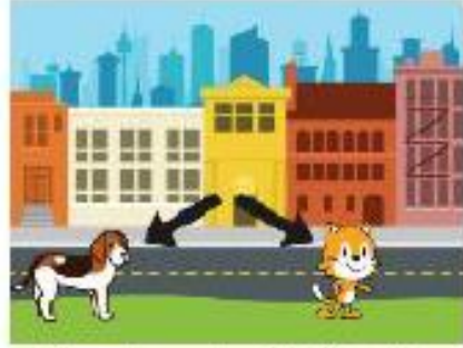
قرار دادن شکلک‌ها در جای مناسب