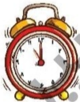
ساعت ..... است.

۱۲ زمانی را که هر ساعت نشان می‌دهد بنویس.