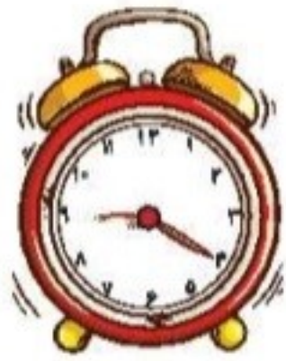
زمان بین ..... و ..... است.