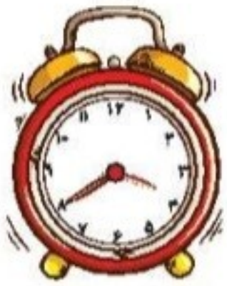
زمان بین ..... و ..... است.