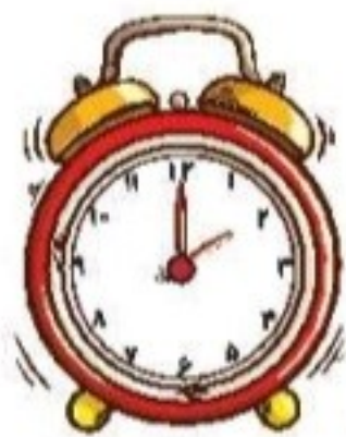
ساعت ..... است.