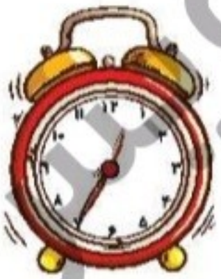
زمان بین ..... و ..... است.