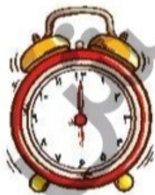
ساعت ..... است.