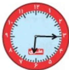
ساعت حرکت از خانه

۱۱. درنا ساعت ۶:۱۵ از خانه به طرف مدرسه رفت و در ساعت ۶:۴۵ به مدرسه رسید. او چند دقیقه در راه بوده است؟ (از تصویر ساعت‌ها کمک بگیر)