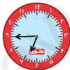
ساعت رسیدن به مدرسه