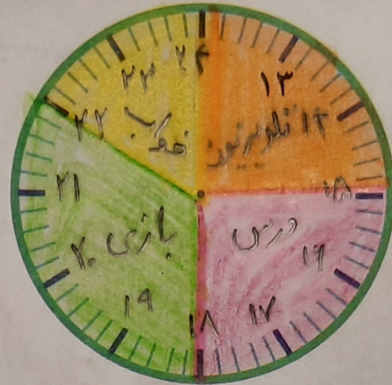
بعد از ظهر