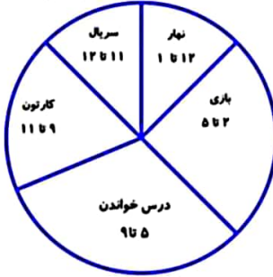
بعد از ظهر

❖ اودر مجموع چند ساعت درس خوانده است ؟ ❖ علی چند ساعت کرتون نگاه کرده است ؟ ❖ درسش را بیش تر خوانده یا کرتون بیش تر نگاه کرده است؟