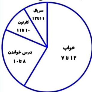
قبل از ظهر

تمام فعالیت های روز جمعه علی در نمودار نشان داده شده است. باتوجه به نمودار به پرسش ها پاسخ دهید.