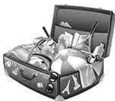
pack for a trip