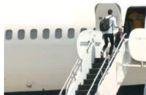
board the plane