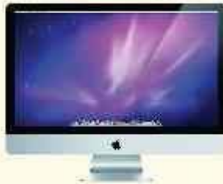
کامپیوترهای شرکت اپل