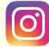
شبکه اجتماعی اینستاگرام