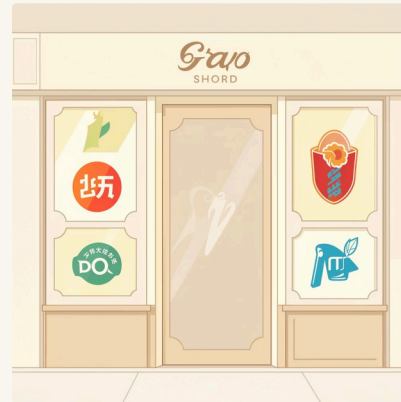
مثل امضای ما

مثلاً لوگوی مک‌دونالدز که حرف M طلاییه، یا لوگوی اپل که یه سیب گاززده‌ست. اینا رو می‌شناسیم، درسته؟