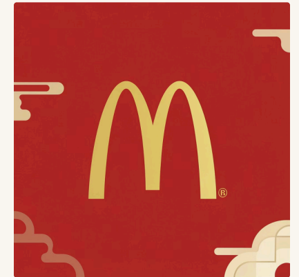
مثل نقاشی کوچولو

مثل امضای خودمون که ما رو از بقیه جدا می‌کنه، لوگو هم یه مغازه رو از بقیه جدا می‌کنه. هر مغازه یه لوگوی منحصر به فرده!