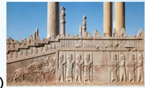
(۱) تخت جمشید