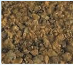
(۲) خاک دانه درشت (خاک دانه درشت)

۸) گزینه‌ی صحیح را مشخص کنید. الف) از کدام خاک، آب زودتر عبور می‌کند؟