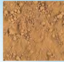
(۱) خاک دانه ریز

ب) کدام یک از بناهای زیر، بزرگ‌ترین بنای خاکی جهان است؟