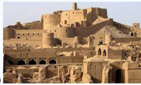
(۲) ارگ بم

ب) کدام یک از بناهای زیر، بزرگ‌ترین بنای خاکی جهان است؟