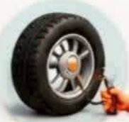
بادکرده چرخ ماشین