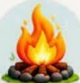
روشن کردن آتش

در روشن کردن آتش، حرکت قایق‌های بادبانی، تولید برق، حرکت هواپیما در آسمان، خشک شدن لباس‌های شسته شده، بادکرده چرخ ماشین و حرکت آسان ماشین به روی آسفالت خیابان.