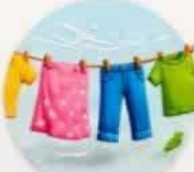
خشک شدن لباس‌های شسته شده