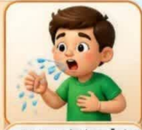
بخش آب دهان با بینی روی زمین و سرفه و عطسه بدون پوشش