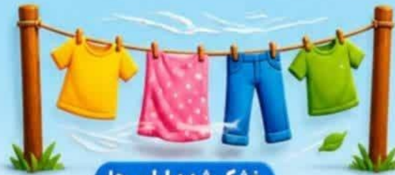
خشک شدن لباس‌ها