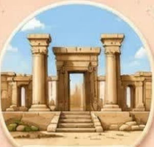
ساخت بناهای قدیمی