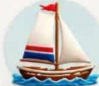
حرکت قایق‌های بادبانی