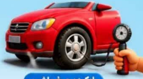
بادکرده چرخ ماشین