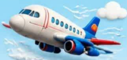
حرکت هواپیما در آسمان