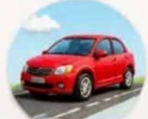
حرکت آسان ماشین روی آسفالت خیابان