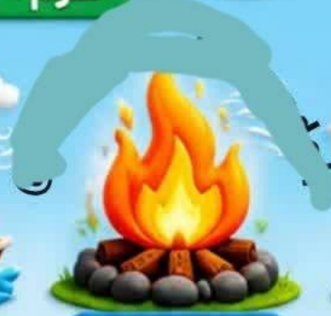
روشن کردن آتش