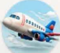
حرکت هواپیما در آسمان