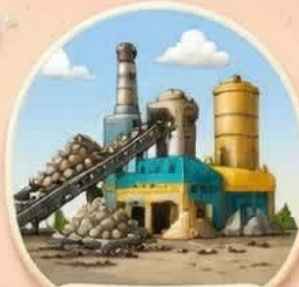
کارخانه‌های تولید مواد