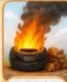
سوزاندن چوب و لاستیک ماشین‌ها