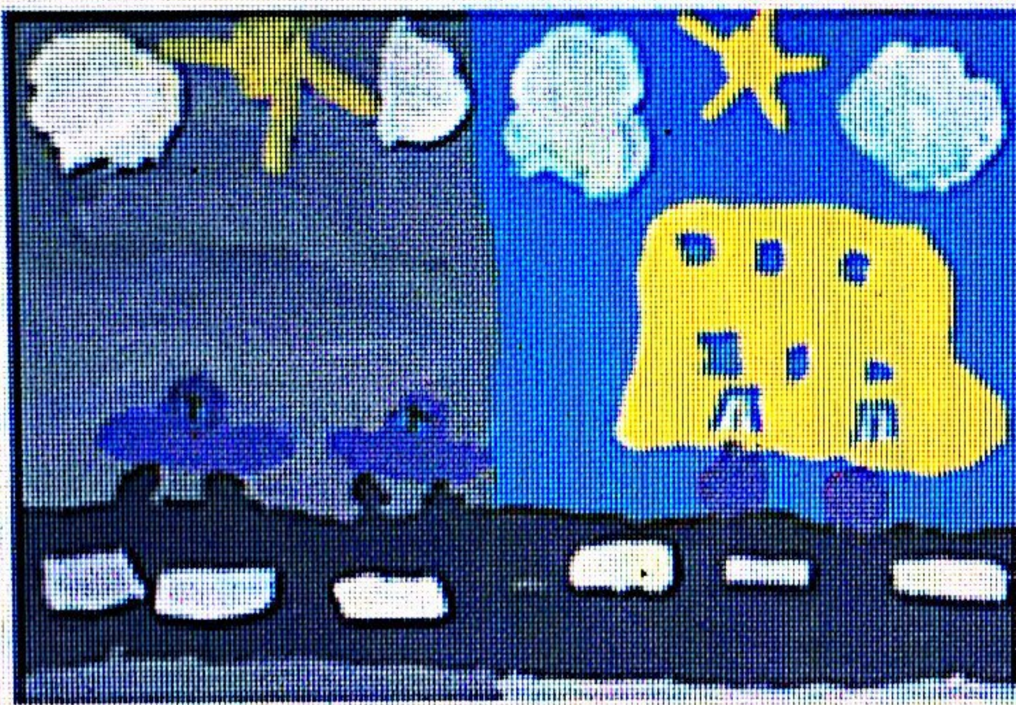
با استفاده از وسایل تبلیغی بسوی بچه ها خود روخوانی شخصی کم سوخت بین دستها صرفه جویی کنیم.

بچه ها در کلاس با معلم خود درباره ی استفاده ی درست از سوختها گفت و گو می کنند. قرار است آن ها با درست کردن یک پوستر یا تابلو مردم را به استفاده ی درست از سوختها تشویق کنند.