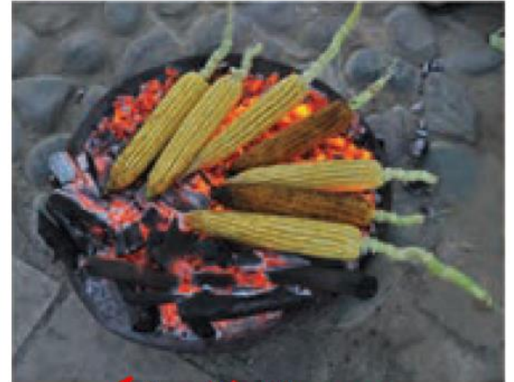
چوب یا زغال سنگ

آیا تا به حال برای پختن غذا از چوب استفاده کرده‌اید؟ آیا موافقید دیگران هم این کار را انجام دهند؟ چرا؟