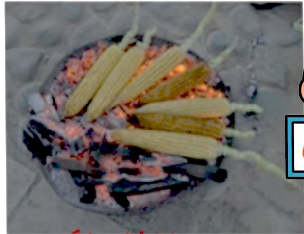
چوب یا زغال سنگ