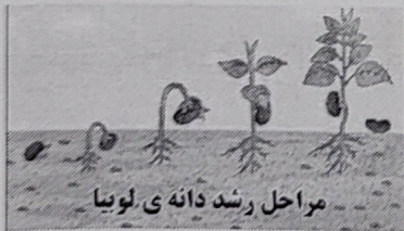
مراحل رشد دانه‌ی لوبیا