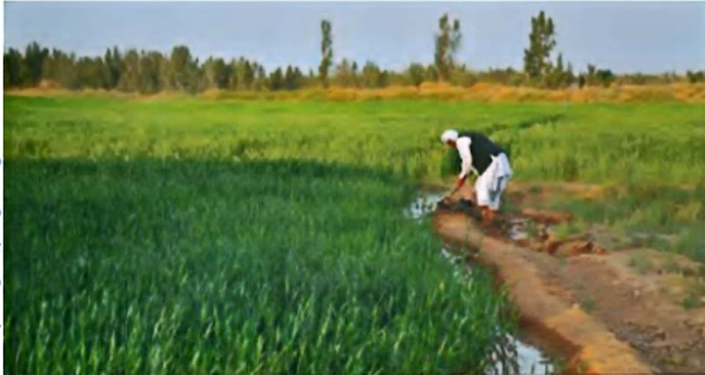
استان سیستان و بلوچستان - اطراف زقی

شغل‌هایی مانند کشاورزی، ماهیگیری، غواصی، کشتیرانی و... به آب وابسته است.