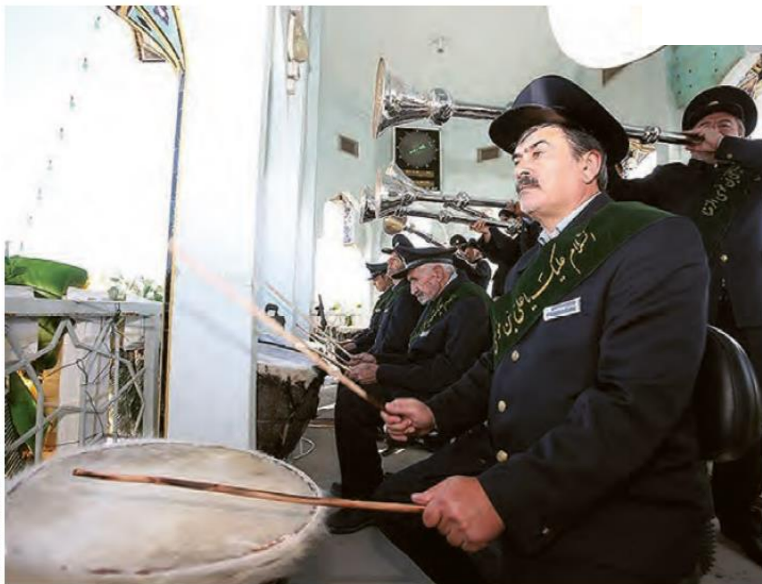
استان خراسان رضوی - شهر مشهد