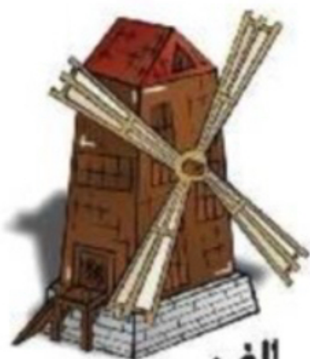
الف آسیاب بادی

چگونه از هدر رفتن نان جلوگیری کنیم؟ (۳ مورد)