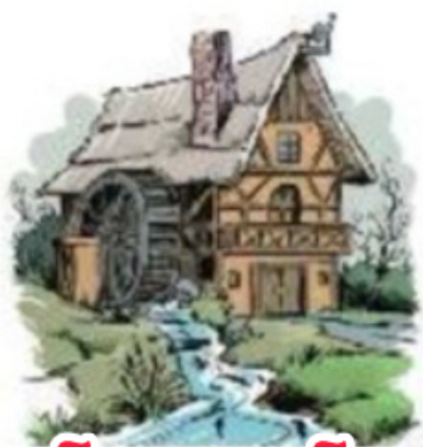
ب آسیاب آبی