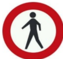
عبور عابر پیاده ممنوع