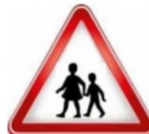
محل عبور دانش آموزان