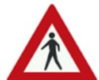
محل عبور عابر پیاده