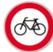
عبور دوچرخه سوار ممنوع