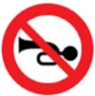
بوق زدن ممنوع

۵- هریک از تابلوهای زیر چه نشانه ای هستند و چه پیامی برای مادرانند؟