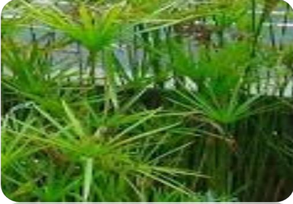
دراز و باریک