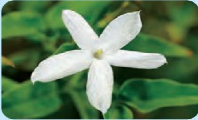
گیاه گل یاس

تصویر روبه‌رو گیاه یاس را نشان می‌دهد. برگ‌های این گیاه پهن هستند و گل‌های آن پنج گلبرگ دارند. در گذشته گیاه یاس در بسیاری از خانه‌ها وجود داشت و در بهار بوی گل‌های آن هوا را خوش بو می‌کرد. بوی گل یاس آرام‌بخش است. از گل یاس در ساختن عطر استفاده می‌شود. با گل‌های یاس دمنوش درست می‌کنند.