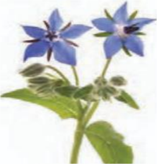
گیاه گل گاوزبان

پیش‌بینی می‌کنید دانه و ریشه‌ی گیاهی که در تصویر زیر می‌بینید از چه نوعی باشد؟