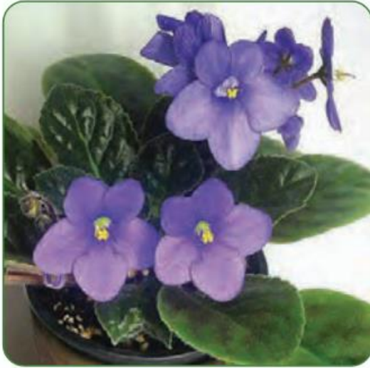
گل بنفشه‌ی آفریقایی

با نگاه کردن به شکل برگ‌های گل بنفشه و سوسن، نوع ریشه و دانه‌ی این گل‌ها را حدس بزنید.