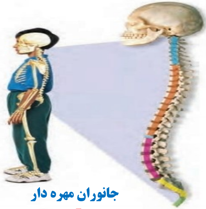
جانوران مهره دار

برآمدگی‌هایی که لمس کردید، بخشی از ستون مهره‌های شما هستند. در بدن انسان ستون مهره‌ها از گردن شروع می‌شود و تا پایین‌تر از کمر ادامه می‌یابد.