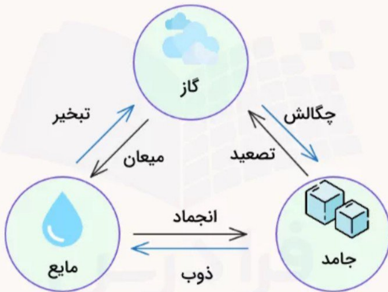
چرخه تبدیل حالت‌های مواد