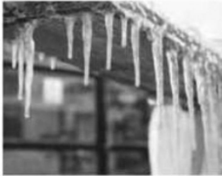
(تشکیل قندیل در زمستان)

۸- شکل داده شده، کدام تغییر حالت را بیان می‌کند؟