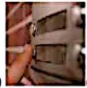
۱) (زنگ زدن)

ب) در هر شکل نیرو به چه صورت وارد می‌شود؟ (کشیدن، هل دادن و یا هم به صورت کشیدن و هم به صورت هل دادن)