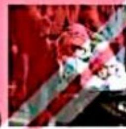
۲) (حرکت دادن کلسکه)