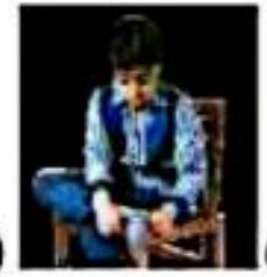
۳) (پوشیدن جوراب)