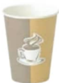
لیوان کاغذی بزرگ