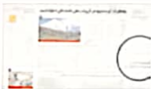
یک صفحه‌ی روزنامه