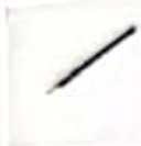
مداد و کاغذ