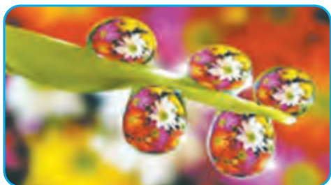
تصویر گل‌ها در قطره‌های آب

گاهی نور در طبیعت، هنگام عبور از یک قطره‌ی آب، به رنگ‌های گوناگون تجزیه نمی‌شود بلکه تصویری از جسم، درون قطره‌ی آب تشکیل می‌شود.