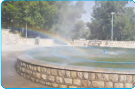
رنگین کمان در فواره ی آب

در یک روز بارانی بعد از نمایان شدن خورشید، رنگین کمان زیبایی در آسمان تشکیل شد. دانش آموزان که از دیدن رنگین کمان خوشحال شده بودند، آن را به یکدیگر نشان می دادند و درباره ی آن صحبت می کردند.