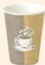
لیوان کاغذی بزرگ