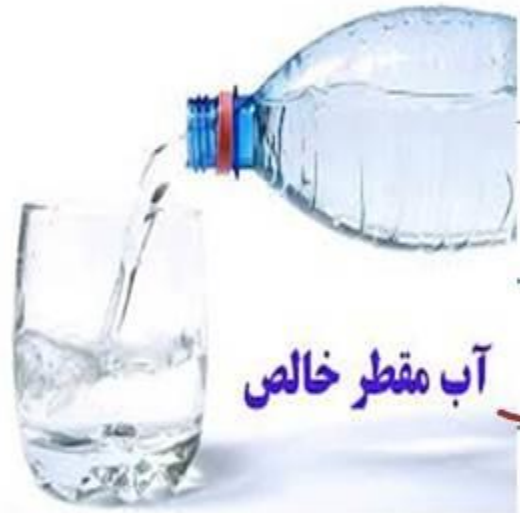
آب مقطر خالص