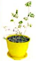
دو گلدان عدس