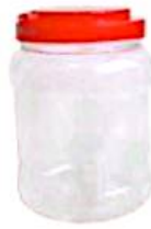
دو ظرف پلاستیکی شفاف و دردار