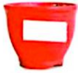
۵ گلدان پلاستیکی کوچک