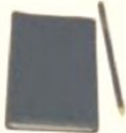
مداد و دفترچه یادداشت