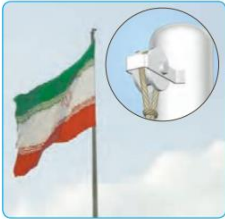
کاربردهای قرقره الف) برافراشتن پرچم

وقتی کار ساختمان سازی به طبقه های بالا می رسد، با استفاده از سطح شیب دار نمی توانیم اجسام را تا ارتفاع زیادی بالا ببریم. برای این کار از قرقره استفاده می کنیم. در اینجا بعضی از کاربردهای قرقره را می بینید.