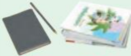
دفترچه یادداشت و مداد چند کتاب