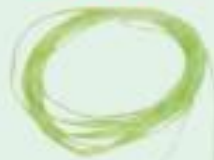
مقداری نخ کلفت