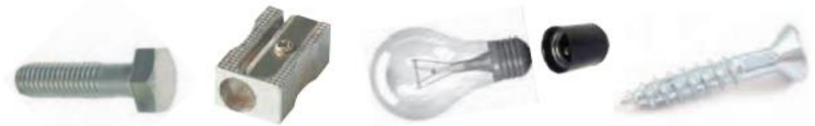
انواع پیچ و کاربردهای آن

پیچ ها در زندگی روزانه کمک های زیادی به ما می کنند. برای مثال، با پیچ می توانیم دو قطعه را به هم وصل کنیم یا جسمی را روی دیوار نصب کنیم. تصویرهای زیر، نمونه هایی از پیچ ها و کاربرد آنها را نشان می دهند.