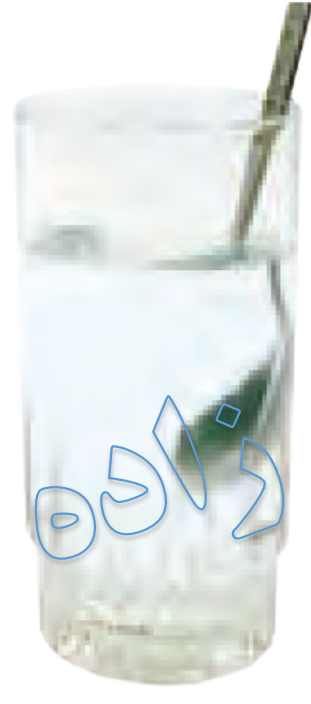
آب و قند پس از هم زدن

وقتی دو یا چند ماده را روی هم می ریزیم، گاهی مخلوط‌های شفاف به دست می آوریم؛ مانند آب و نمک یا آب و قند. اما گاهی مخلوط‌های شفاف به وجود نمی آیند. برای مثال، اگر ماست را با آب مخلوط کنیم، دوغ به دست می آید که شفاف نیست و پس از مدتی ته نشین می شود. این نوع مخلوط‌ها، محلول نیستند.