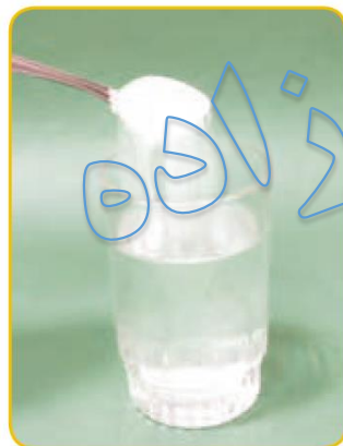
آب و نمک

در نمونه‌های زیر، مخلوط‌های یک‌نواخت را مشخص کنید. دلیل خود را بیان کنید.