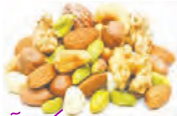
مخلوط دانه های خوراکی ( آجیل )