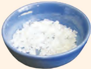
نبات خرد شده