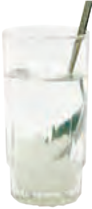
آب و قند قبل از هم زدن