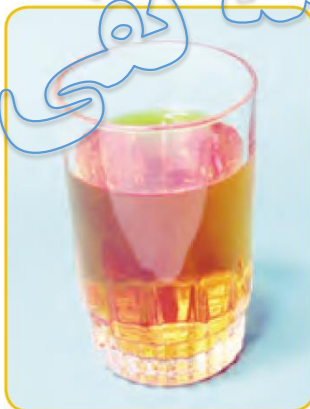
زعفران دم‌کرده و صاف‌شده