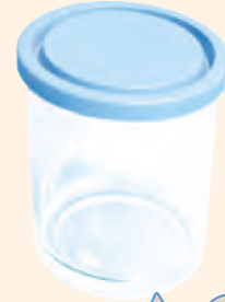
ظرف شیشه‌ای دردار