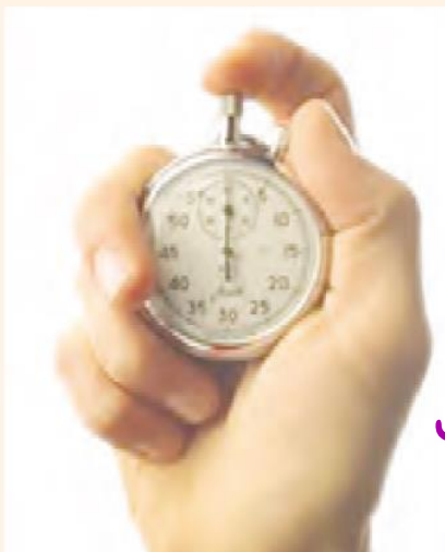
شور زمان سنج