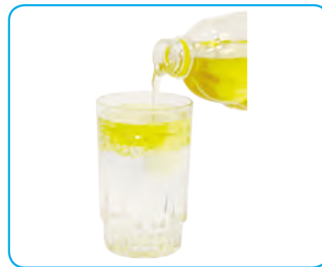
آب و روغن