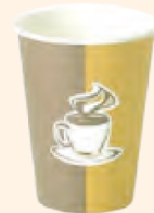
لیوان یونولیتی یا کاغذی