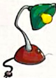
الکتریکی به نورانی