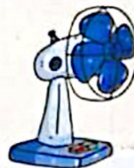
الکتریکی به حرکتی