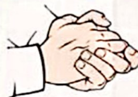
حرکتی به گرمایی

نام اجزای مشخص شده در شکل را نوشته و وظیفه‌ی هر قسمت را بنویسید.