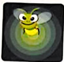
شیمیایی به نورانی

برچسب تبدیل‌های انرژی مربوط به هر تصویر را در جای خود قرار دهید.