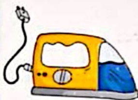
الکتریکی به گرمایی