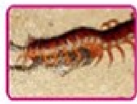
هزارپای گوشت خوار

بندپایان هنگام رشد کردن چندبار پوشش سخت خود را عوض می کنند. به این کار پوست اندازی می گویند.