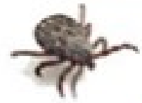
۴ تکه انتقال بیماری و مزاحمت