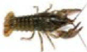
۳ خرچنگ دراز