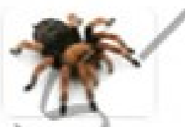
۲ عقرب جنده درشت و ظهری کرم‌دار دارد.