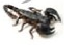
۳ عقرب دمش نیش زهری دارد.