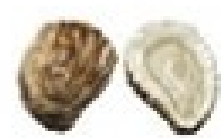
صدف دوکته ای