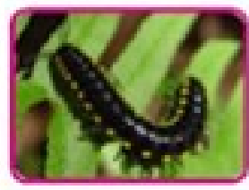
هزارپای غله خوار

تعداد این جانوران از بقیه کم تر است و در هر قطعه از بدن یک جفت پا دارند. هزارپایان به دو دسته گوشت خوار و گیاه خوار تقسیم می شوند. هزارپای گوشت خوار سمی است و لی سم آن برای انسان ضرر ندارد. هزارپایها در جاهای تاریک و مرطوب زندگی می کنند.