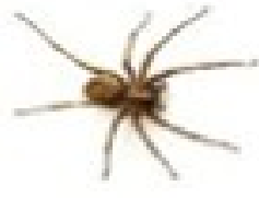
۱ عنکبوت غده‌های تولید تار دارد.