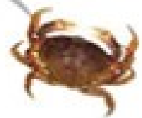
۱ خرچنگ پهن

این گروه دارای پوستی محکم (اسکلت سخت خارجی) و بدن دو قسمی (سر، سینه و شکم) هستند و معمولاً بیش از ۸ پا (۴ جفت) دارند. برخی از سخت‌پوستان، غذای ماهی‌ها را تشکیل می‌دهند.