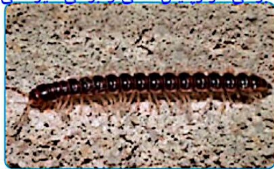
دو نوع هزارپا