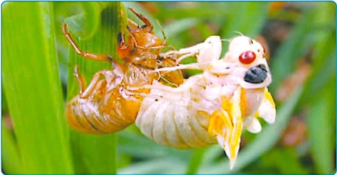
حشره در حال پوست اندازی

دانشمندان عنکبوتیان، حشرات، سخت پوستان و هزارپایان را در یک گروه بزرگ به نام بندپایان طبقه بندی می کنند. چرا این گروه ها را گروه بزرگ بندپایان می نامند؟ چون بدن و پاهای بند بند دارند بدن بندپایان پوشش سختی دارد. آنها هنگام رشد کردن چند بار پوشش سخت خود را عوض می کنند؛ به این کار پوست اندازی می گویند.