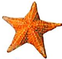
ستاره ی دریایی