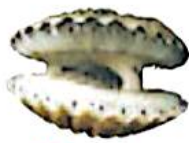
صدف دو کفه ای

جانوران بی مهره ی دیگری نیز وجود دارند که در آب و خشکی زندگی می کنند.