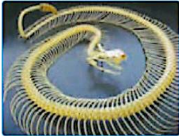
ستون مهره‌های مار

* بدن کرم خاکی و بدن مار، چه شباهت‌ها و چه تفاوت‌هایی دارند؟ مار ستون مهره دارد و جانوری مهره‌دار است در حالی که کرم خاکی ستون مهره ندارد. به جانورانی که ستون مهره ندارند، جانوران بی‌مهره می‌گویند. مورچه، کفشدوزک، شته، عنکبوت و بسیاری از جانوران دیگر بی‌مهره‌اند.