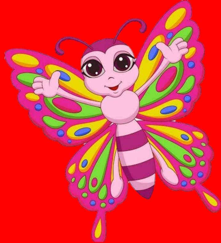
صدای اول پ