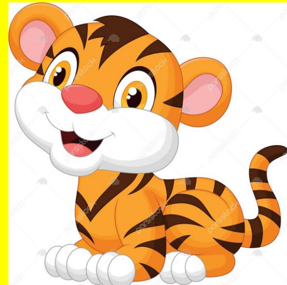
صدای اول بـ