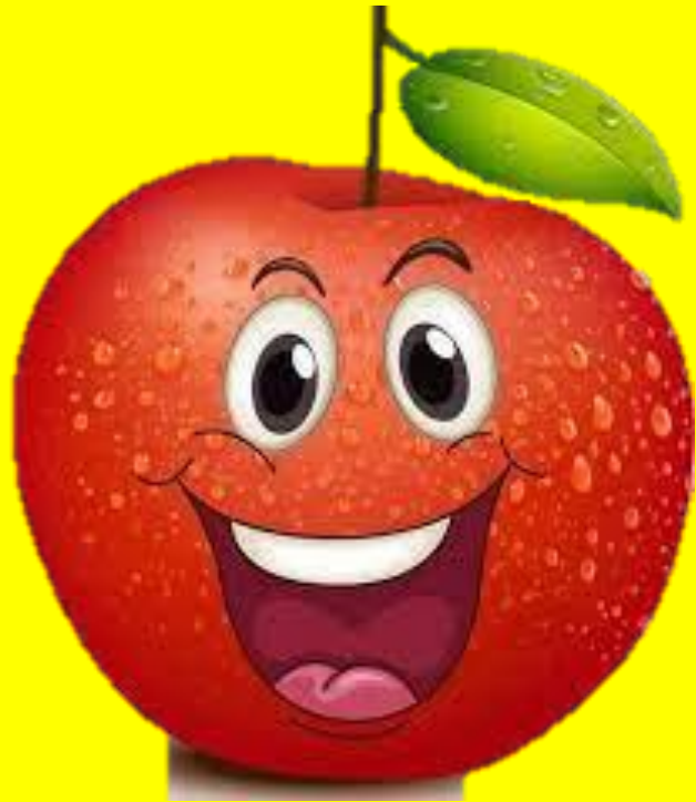
صدای اول سـ

گلم با صدای اول تصاویر داده شده اسم و فامیل بازی کن