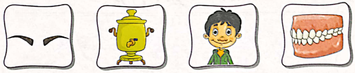
آ... برو سآور آ... مین دندان

۲ با نشانه‌های «آ» و «ا»، کلمه‌ها را کامل کن.