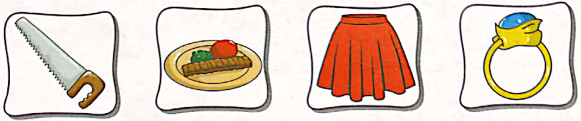
آ... ره گآب دامن آ... نگشتر