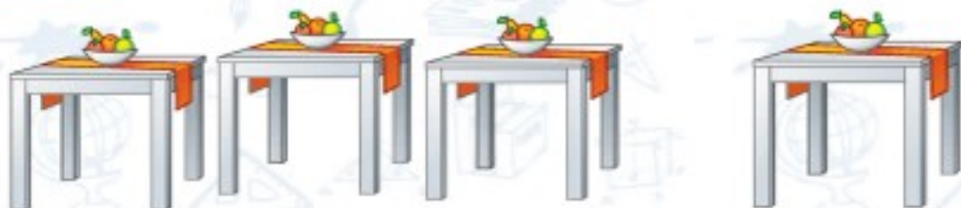
میزها یعنی چند میز