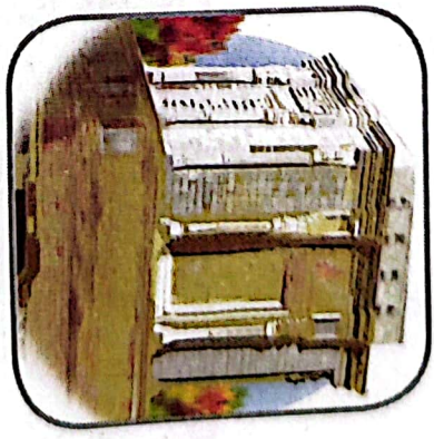
۱- آبراهنگاه خروسی