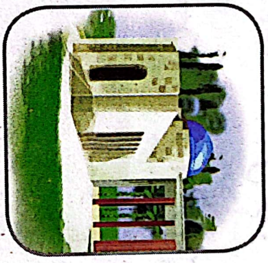
۲- آبراهنگاه سعیدی