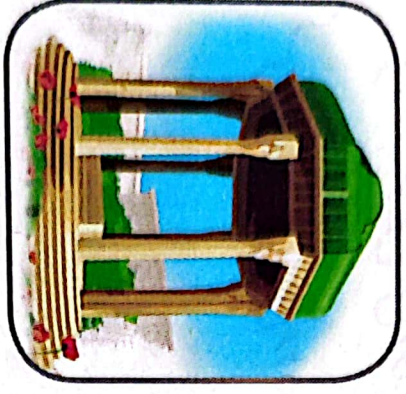
۳- آبراهنگاه جلایر