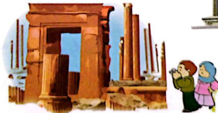
اینجا تخت جمشید در مرودشت فارس است.