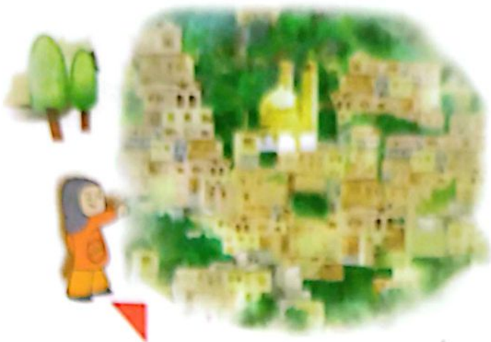
اینجا ماسوله‌ی گیلان است.