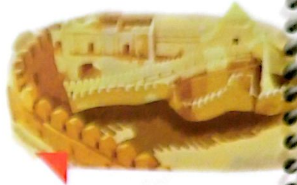
اینجا درگیم کرمان است.