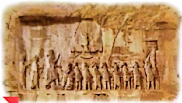
این تصویری از بیستون کرمانشاه است.