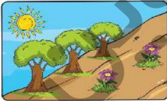
زمین شیب‌دار و پوشیده از گیاه