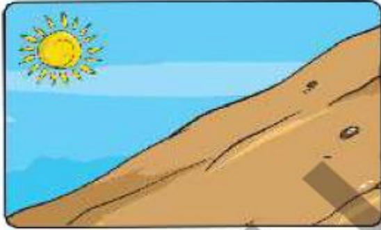
زمین شیب‌دار و بدون گیاه