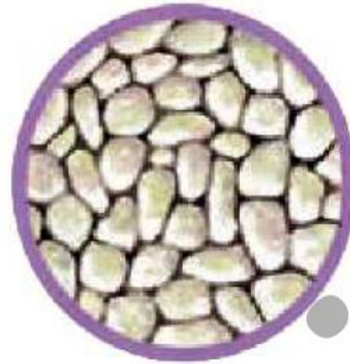
(۱) خاک رس

کدام خاک هم نفوذپذیری خوبی دارد و هم آب را به خوبی در بین ذراتش نگه می‌دارد؟