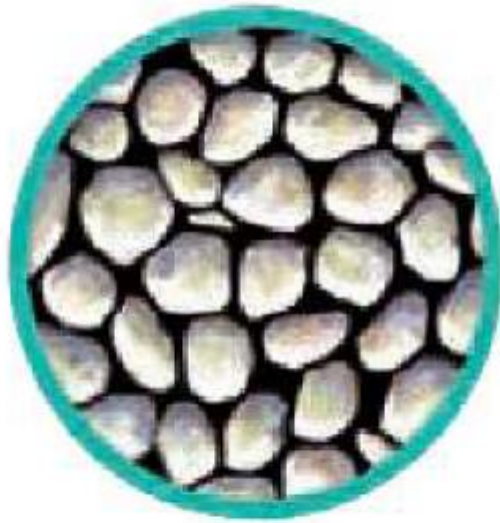
(۲) ماسه‌ی نرم